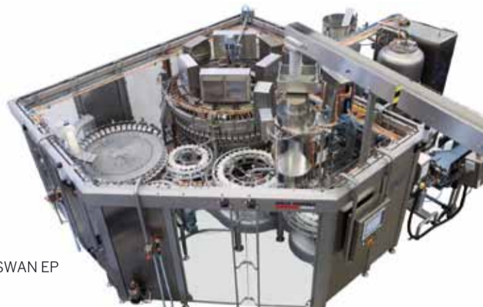
Riempritrice modulare SWAN EP

Questi nuovi sistemi sono frutto dello sviluppo della serie "ISO EP" e risultano particolarmente adatti sia per prodotti fermi che per CSD. Nel loro ciclo progettuale e costruttivo sono stati curati con attenzione diversi importanti aspetti fra i quali: una struttura particolarmente robusta e di sicuro impiego, il sistema di guida, movimentazione e sollevamento delle bottiglie, il serbatoio per il liquido di riempimento oltre naturalmente alle particolari valvole ISO EP. Queste valvole, integralmente costruite in acciaio inox Aisi 316, sono dotate di cannula ad